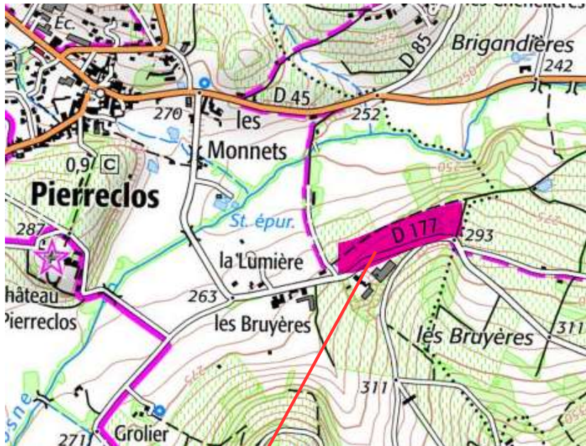
Secteur d'implantation de la gendarmerie

Le lieu d'implantation du projet est situé au sud-est du bourg, lieu dit les Bruyères sur les parcelles cadastrales 510 à 512, section B zone agricole non constructible.