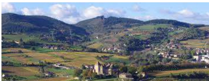
Illustration 1: Pierreclos, vignoble et château

Déclaration de projet n° 1 pour la construction d'une gendarmerie à Pierreclos (71) emportant mise en comptabilité du plan local d'urbanisme intercommunal de l'ex-communauté de communes du Mâconnais Charolais.