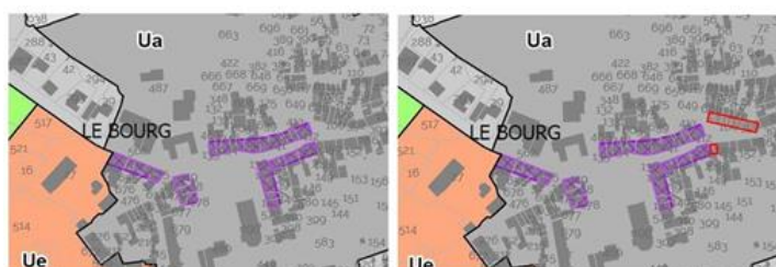
01C. Matour Maire. Zone de diversité commerciale à protéger. Avant / Après

Modification simplifiée n°2 : Étendre la zone commerciale à protéger située sur la rue principale commerçante de Matour jusqu'au n° 31-33 côté impair et n° 14 côté pair