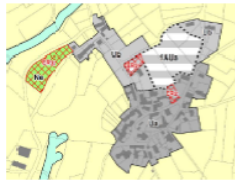
Extrait du règlement graphique du Plan Local d'Urbanisme intercommunal sur la commune de La Chapelle-du-Mont-de-France avant la présente modification simplifiée n°3 du PLU

L'emplacement réservé n°02 sur la commune de La Chapelle-du-Mont-de-France, d'une superficie de 758m 2 , est supprimé sur le règlement graphique du PLU.