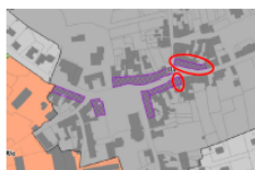
Linéaire d'activités après la modification simplifiée n°2 15