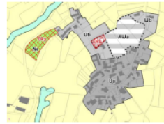
Extrait du règlement graphique du Plan Local d'Urbanisme intercommunal sur la commune de La Chapelle-du-Mont-de-France après la présente modification simplifiée n°3 du PLU

Latitude - Modification simplifiée n°3 du PLU de l'ex-communauté de communes de Matour et sa Région