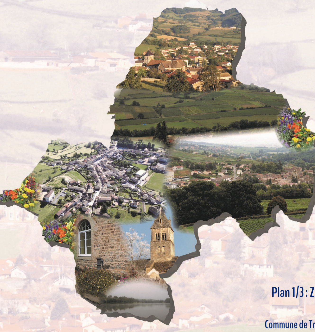
Plan I/3: Zonage