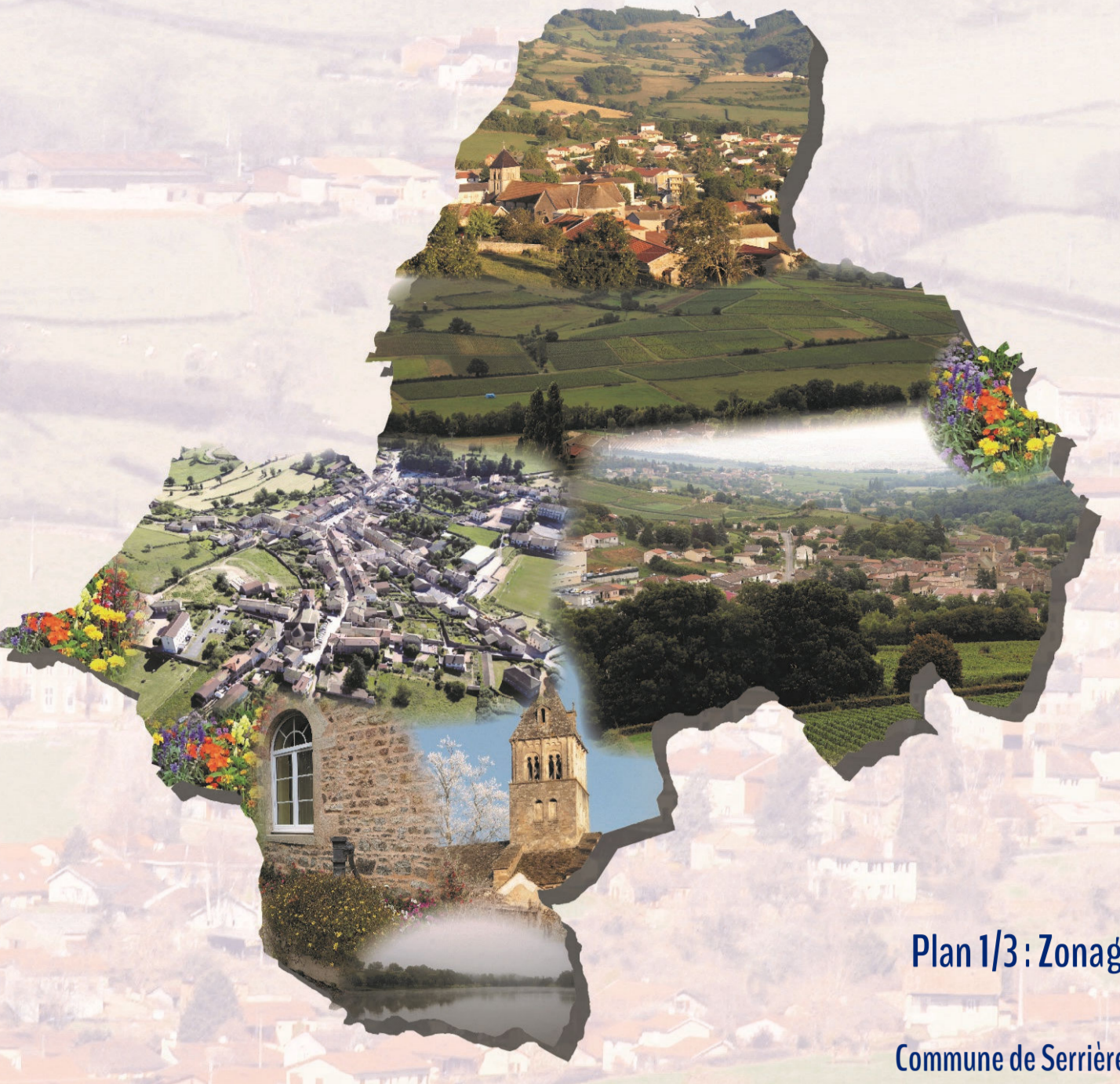
Plan 1/3 : Zonage Commune de Serrières