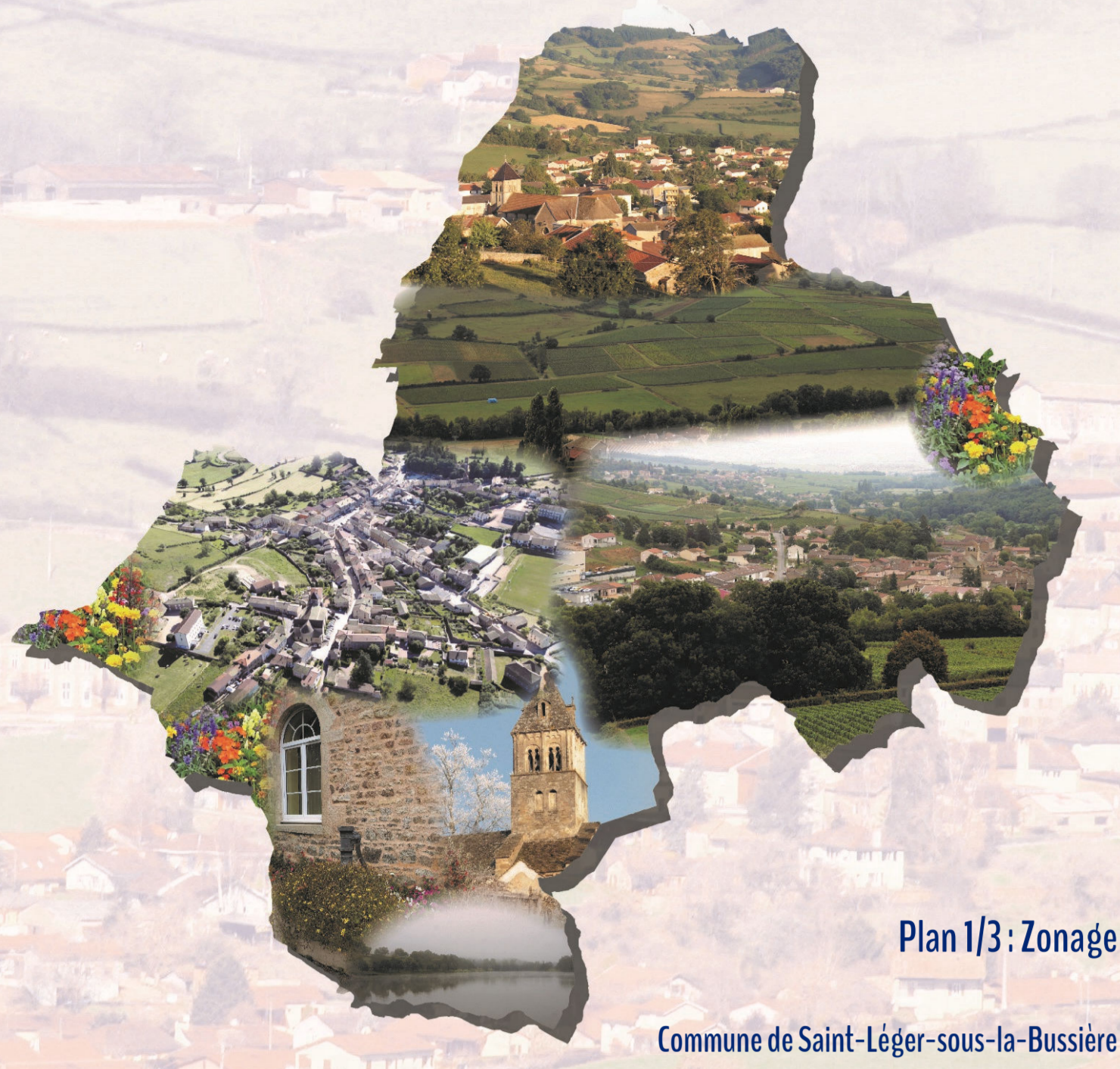
Plan 1/3 : Zonage