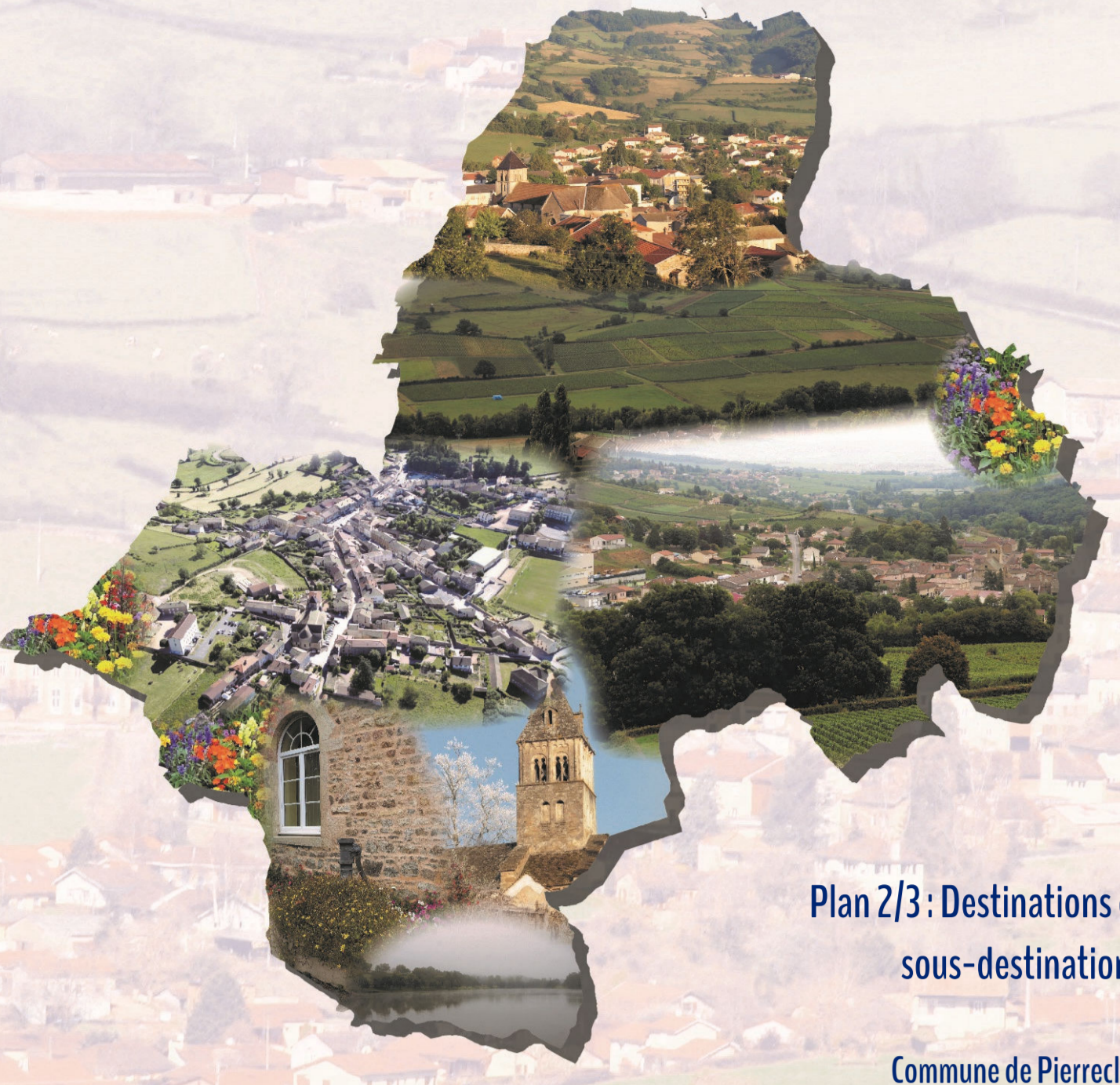
Plan Z/3 : Destinations et sous-destinations