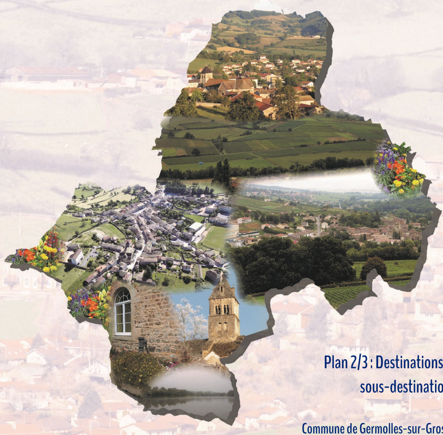
Plan 2/3 : Destinations et sous-destinations