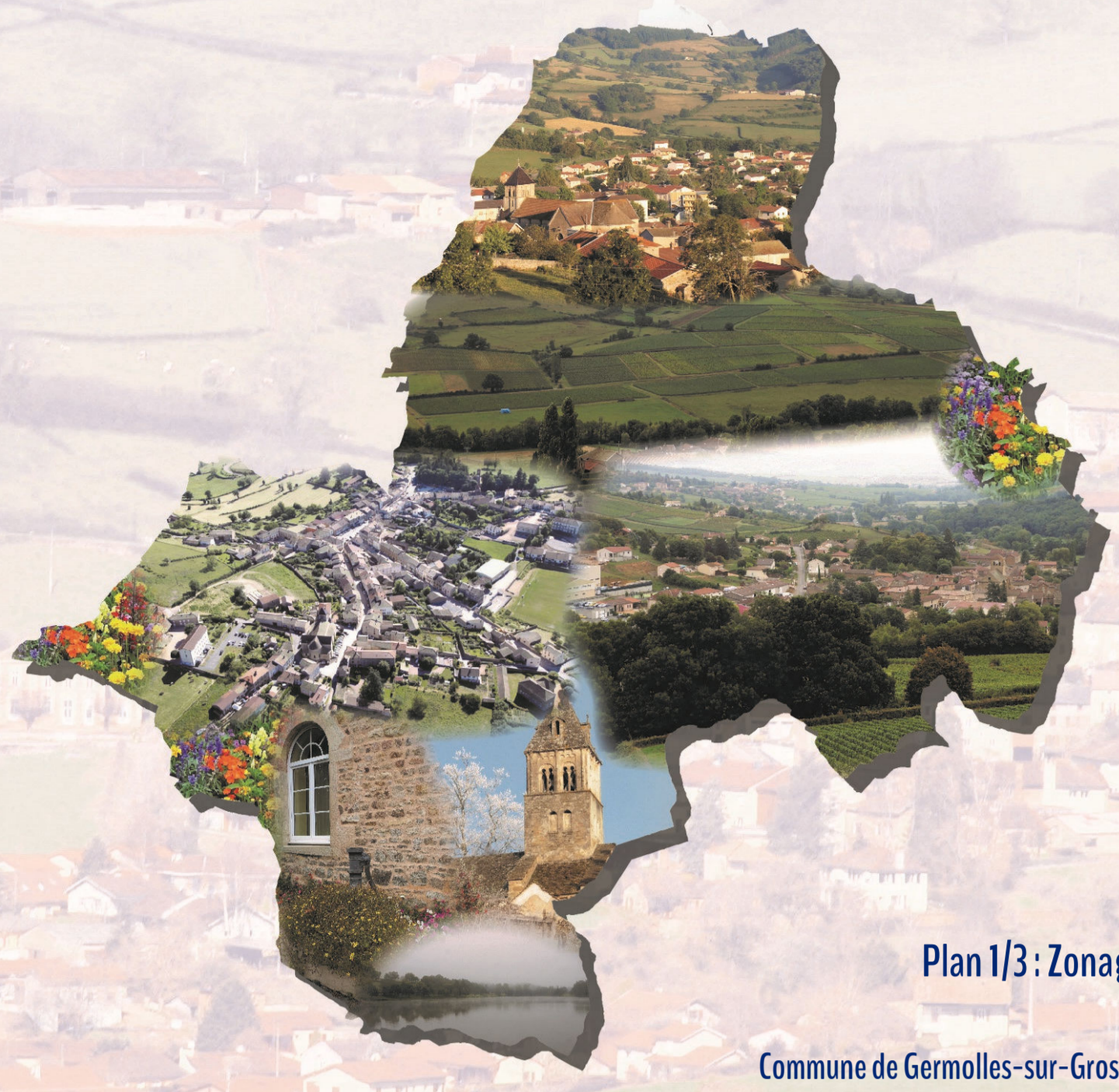
Plan 1/3: Zonage