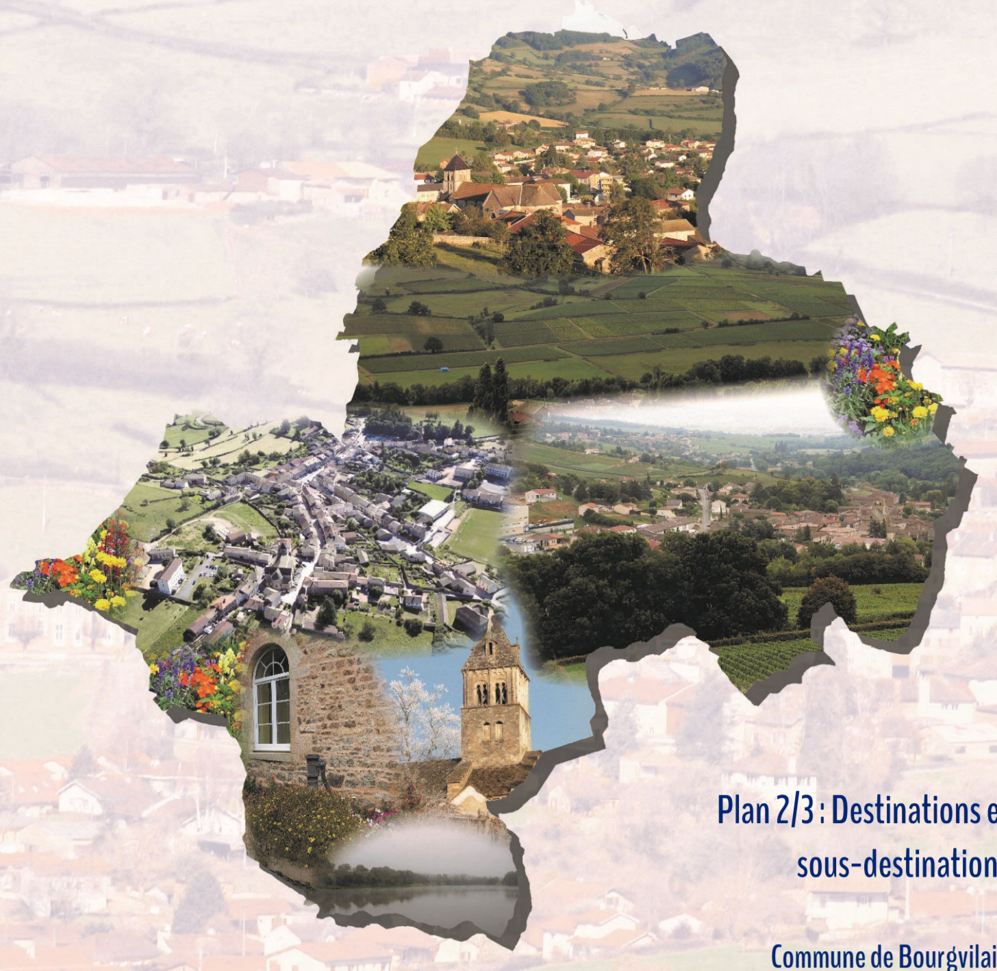
Plan 2/3 : Destinations et sous-destinations